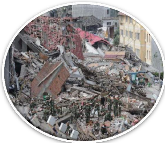
중국 쓰촨성 지진(2008)

인명피해 : 69,226명 실종자 : 17,923명 건물피해 : 약 450만 동