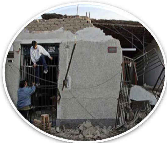
페루 이카 지진(2007)